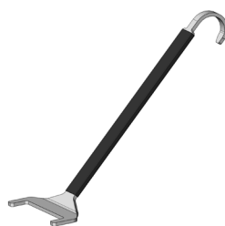
Hebewerkzeug mit Aushebehaken