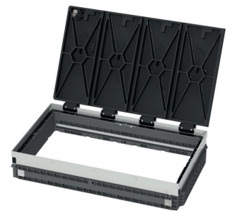
Rechteck-Schwenkabdeckung EK 428 geöffnet