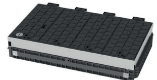
Rechteck-Schwenkabdeckung EK 428 geschlossen