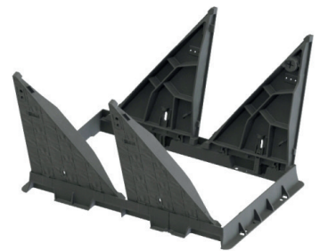
Dreieck-Schwenkabdeckung EK 428 geöffnet