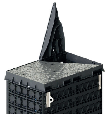
Dreieck-Schwenkabdeckung auf einem Beispielschacht; 1 Abdeckung geöffnet