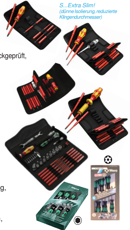
S...Extra Slim! (dünne Isolierung, reduzierte Klingendurchmesser)