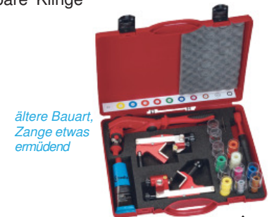
ältere Bauart, Zange etwas ermüdend