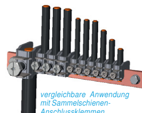
vergleichbare Anwendung mit Sammelschienen- Anschlussklemmen