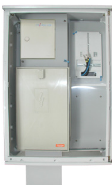
290390 (Abb. ohne Tür über Hauptsicherung sowie ZS 25mm 2 , ohne ZAK)