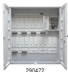
290472 FHZV 6/B6/H1250/R-K

K013-Sperren für Außentüre, sowie Typen auch mit Überspannungs-Ableitern und mehr Zählerplätzen auf Anfrage!