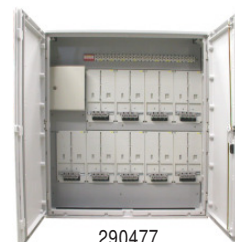
290477 FHZV 9/B6/H1250/L-K