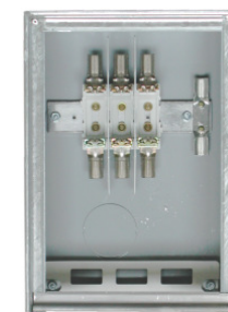
190147 / 190167