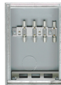
190001 / 190165

Nach Aufbringen einer Feinputzschicht ist vom Kasten lediglich die Schlosskappe und das Netz NÖ-Schildchen zu sehen! Für das Zylinderschloss BB wird eine spezielle Schließzunge mitgeliefert!