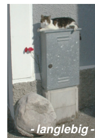
- langlebig -