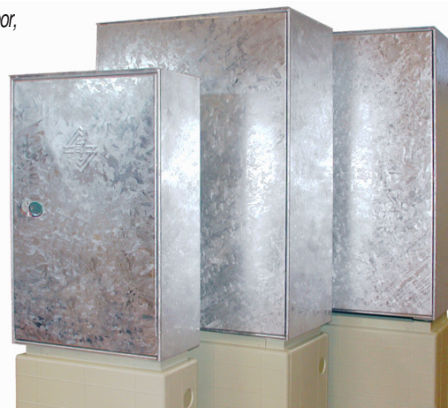
190055 / 190056 / 190057 auf Sockel

outdoor cabinets empty (enclosures e.g. for electrical use e.g. as underground serviced streetlight pedestals), made from long-living, sturdy steel sheet hot-dip galvanized or lightweight Aluminium powder coated, free standing e.g. on polyester bases, removable front opening service door, individual configurability; from hot-dip galvanized steel sheet; individual powder coating; nylon cable brushes